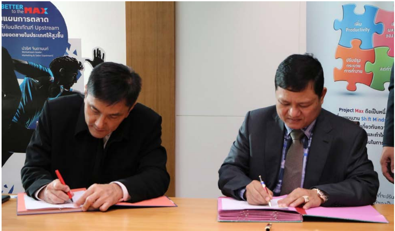
(ពិធីចុះហត្ថលេខាលើកិច្ចព្រមព្រៀង ទិញ-លក់ រវាងក្រុមហ៊ុន ប៉ាប៉ា អាត្រូលៀម (PAPA PETROLEUM Co.,Ltd) និងក្រុមហ៊ុន PTTGC (PTT GLOBAL CHEMICAL PUBLIC COMPANY LIMITED) នៅទីស្នាក់ការក្រុមហ៊ុន PTTGC ទីក្រុងបាងកក ប្រទេស កាពីថ្ងៃទី១៧ ខែវិច្ឆិកា ឆ្នាំ២០១៦)