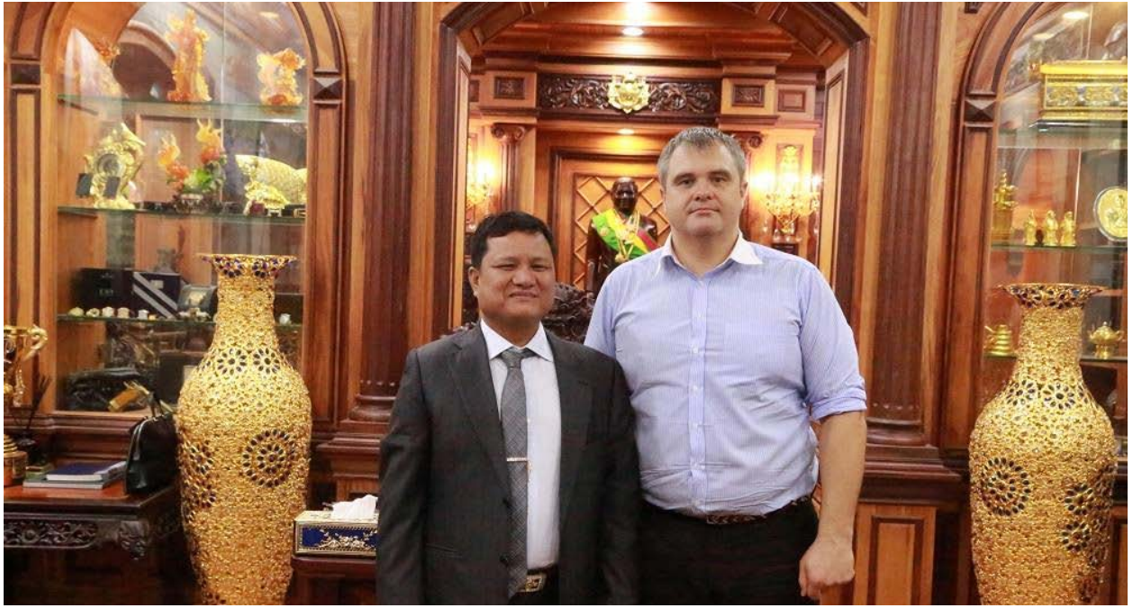
(ទ្រី ភាព និង ក្លាយប្រធានាធិបតីរុស្ស៊ី រូម៉ាន ពូទីន)