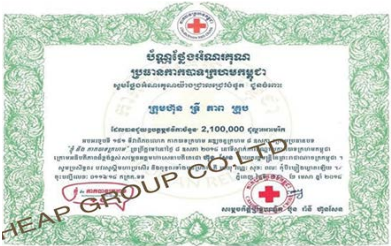
Try Pheap donated 17 US$ 2,100,000 to Red Cross in 2018