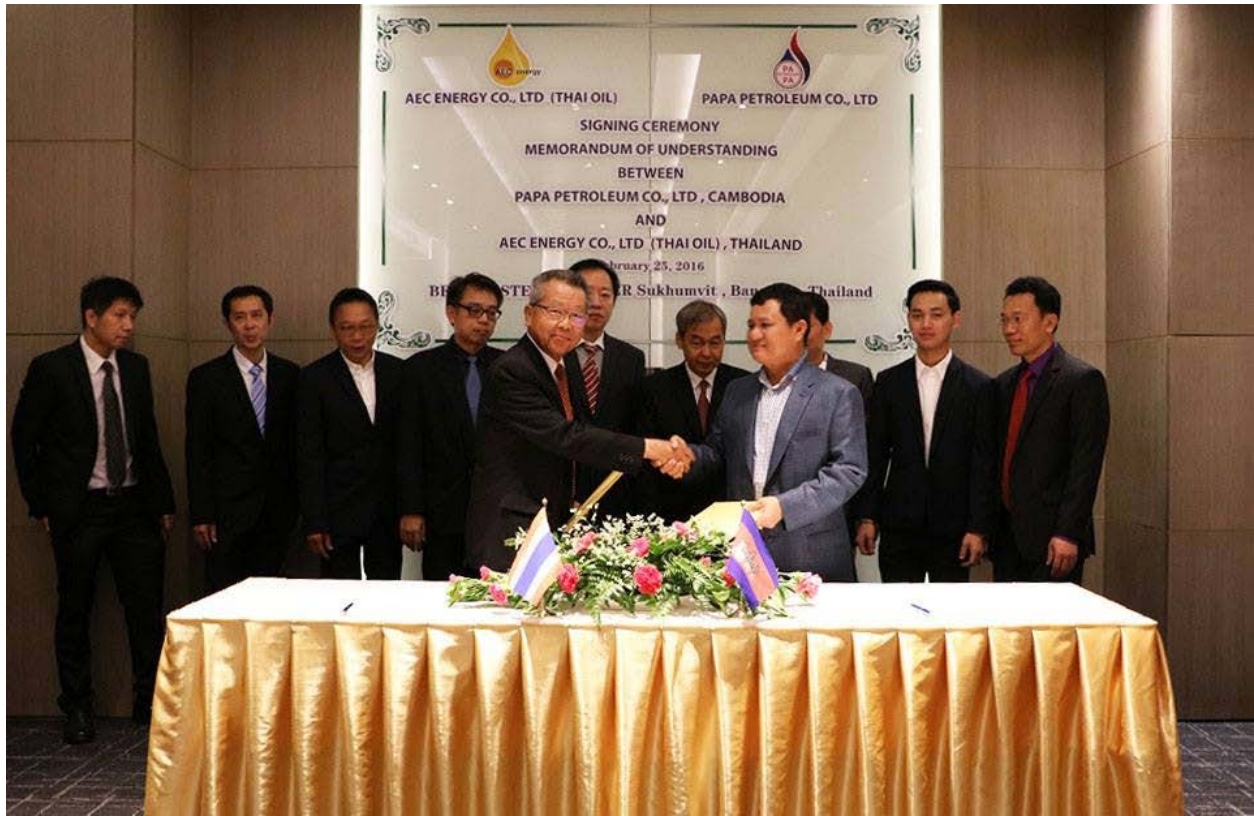
ពិធីចុះហត្ថលេខាលើអនុសារណៈយោគយល់គ្នា (MOU) លើការទិញ-លក់ប្រេងឥន្ធនៈរវាងក្រុមហ៊ុន ប៉ាប៉ា ហេត្រូលៀម និង ក្រុមហ៊ុន AEC 15 នៅថ្ងៃទី 25 ខែ កុម្ភៈ ឆ្នាំ 2016។