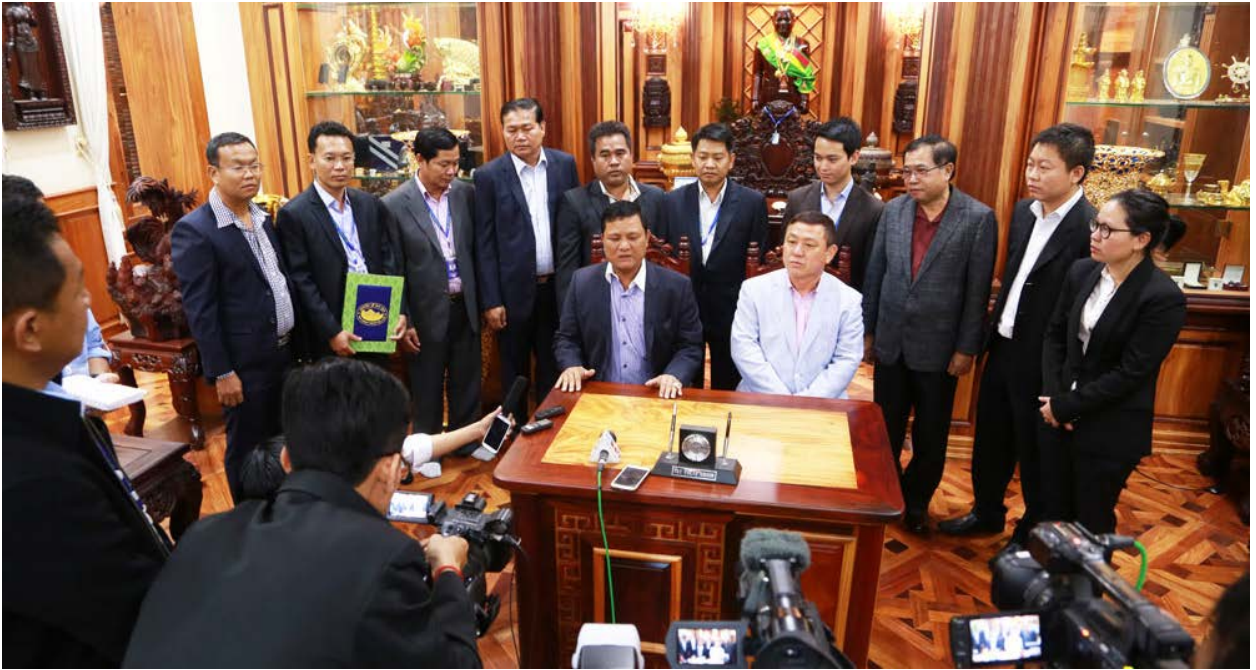
(ក្រុមហ៊ុន ទ្រី ភាព ស៊ីវិល អាជីវកម្មទំនេញ ដំឡូងមី ជាមួយក្រុមហ៊ុន ថៃ)