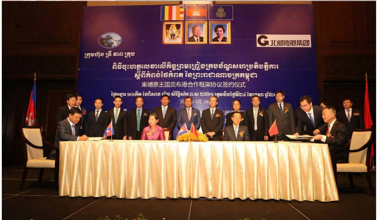
(ពិធីចុះអានុសារណៈយោគយល់គ្នា រវាងទ្រី ភាព គ្រប់ ជាមួយក្រុមហ៊ុនចិន វិនិយោកផ្នែកប្រេង)